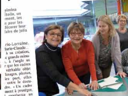
Plusieurs techniques lors de l'atelier de photographie. Les participants ont pu découvrir les secrets de la photographie et partager leurs expériences.