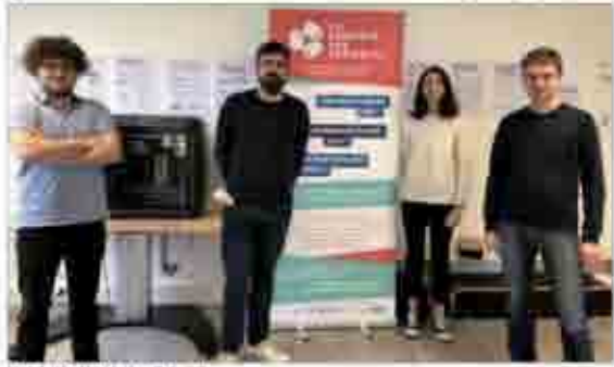
Les bénévoles et le président (à droite).

La fabrique des possibles, c'est faire du numérique un outil d'inclusion et d'émancipation, en particulier pour les micros entreprises, les lycéens et étudiants, les habitants qui veulent se familiariser avec l'outil numérique.