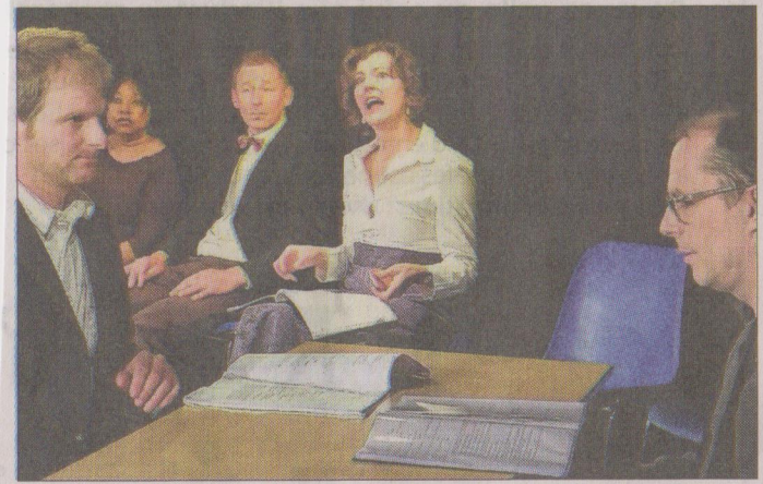
■ L'atelier théâtre de la MJC Etoile a présenté « La Fausse Pièce ».

Le rideau s'est refermé sur la 4 e édition du festival de théâtre « Les Planches de l'Etoile », dimanche après-midi. Retour sur ces quatre jours dédiés au théâtre amateur.