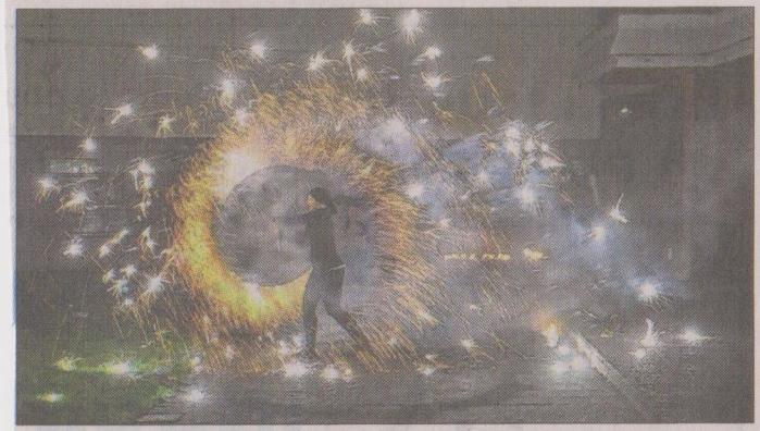
■ Magnifique feu d'artifice des Zipponambules.